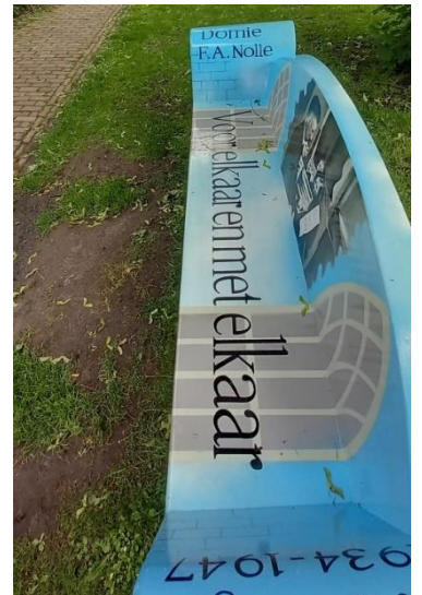
bank bij de Obergumerkerk.

Donderdag 19 september: Rondje om de Toren – Torenkerk Winsum Iedere 3 e donderdag is er een “rondje om de Toren”, een bezinningswandeling van een klein uur, te beginnen bij de Torenkerk (19.30 uur) Kerkstraat 14 in Winsum en eindigend bij de Centrumkerk (20:30 uur) met als afsluiting koffie en thee en wat lekkers. De wandeling begint met een tekst/een gedicht waarna er ca. 10 minuten in stilte wordt gelopen. Daarna wordt er enkele malen stil gestaan voor een kort gedicht of een tekst. Alle deelnemers zijn vrij om tijdens dit rondje stil te zijn, te mijmeren of te praten met mede-lopers. Aan het “rondje” kan iedereen mee doen, aanmelden is niet nodig en het “rondje” gaat altijd door.