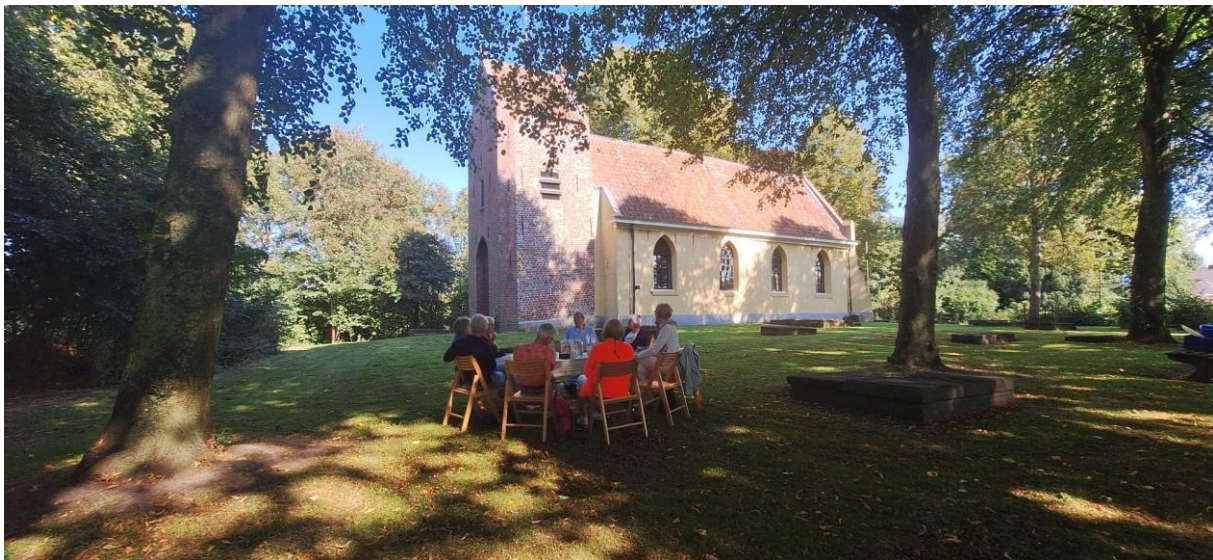
Lunch in de tuin van de Kerk in Westernieland

We pelgrimeerden langs kerken, waar je kon luisteren naar de stilte, poëzie of muziek. We realiseerden ons hoe rijk dit erfgoed is en dat we ook een verplichting hebben om hiervoor zorg te dragen. De eeuwenoude gebouwen met hun unieke interieur en goed onderhouden orgels bezitten uit zichzelf al zoveel sfeer en spiritualiteit dat het ontzettend jammer zou zijn als die deuren gesloten zouden blijven. In Den Andel bezochten we de Dorpstuin, waar een dorpsbewoner ons met veel enthousiasme door de tuin leidde en vertelde over het ontstaan van de dorps tuin en wat er allemaal gebeurt. Wat een oase, dat 'groene hart van Den Andel'. Halverwege de fietstocht hebben we geluncht in de tuin van de kerk in Westernieland. Een zeer geslaagde dag waarop we genoten van (on)bekende fietspaden, oneindige vergezichten, ontmoetingen en ontdekkingen. Niet zo zeer nieuwe dingen, maar dingen die we al hadden en die we opnieuw, in een andere dimensie, zijn gaan waarderen. Als nieuw! En dat is dan toch mooi meegenomen.