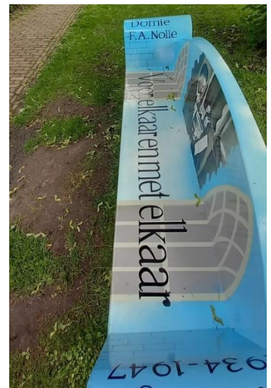
bank bij de Obergumerkerk.

Iedere 3 e donderdag is er een “rondje om de Toren”, een bezinningswandeling van een klein uur, te beginnen bij de Torenkerk (19.30 uur) Kerkstraat 14 in Winsum en eindigend bij de Centrumkerk (20:30 uur) met als afsluiting koffie en thee en wat lekkers. De wandeling begint met een tekst/een gedicht waarna er ca. 10 minuten in stilte wordt gelopen. Daarna wordt er enkele malen stil gestaan voor een kort gedicht of een tekst. Alle deelnemers zijn vrij om tijdens dit rondje stil te zijn, te mijmeren of te praten met mede-lopers. Aan het “rondje” kan iedereen mee doen, aanmelden is niet nodig en het “rondje” gaat altijd door.